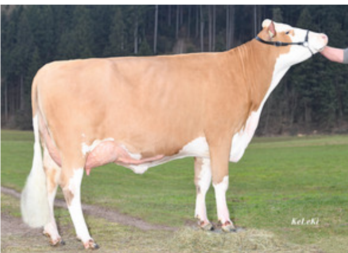
Mutter Marie (i. d. 1. Laktation)

AUS EXTERIEURSTARKER KUHLINE! Mit seinen ersten Töchtern in Milch zeigt MABUSO was er kann und überzeugt mit einer überdurchschnittlichen Milchmengenvererbung bei sensationeller Fett-Vererbung von und leicht positivem Milcheiweiß. Damit trifft er genau, was viele Züchter aktuell nachfragen, eine Verbesserung der Inhaltsstoffe. Im Exterieur überzeugen seine Töchter mit einem optimalen Fundament vor allem in Winkelung, Ausprägung und Fesselung. Die Euter der MABUSO-Töchter gefallen durch sehr gute Euterlänge, optimale Platzierung und Länge der Striche.